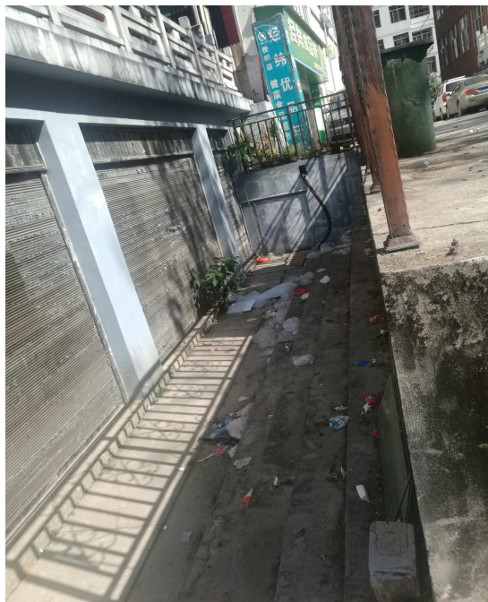
渡口路，州公安局住宿区门口垃圾未进行清理